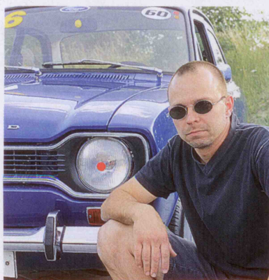
ESCORT MK1 1968