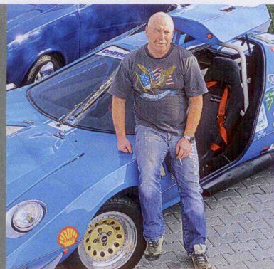
FORD CORTINA EAGLE SS

„Fordy opravuji od převratu, mám je rád a ty šílence od nás z klubu taky.“